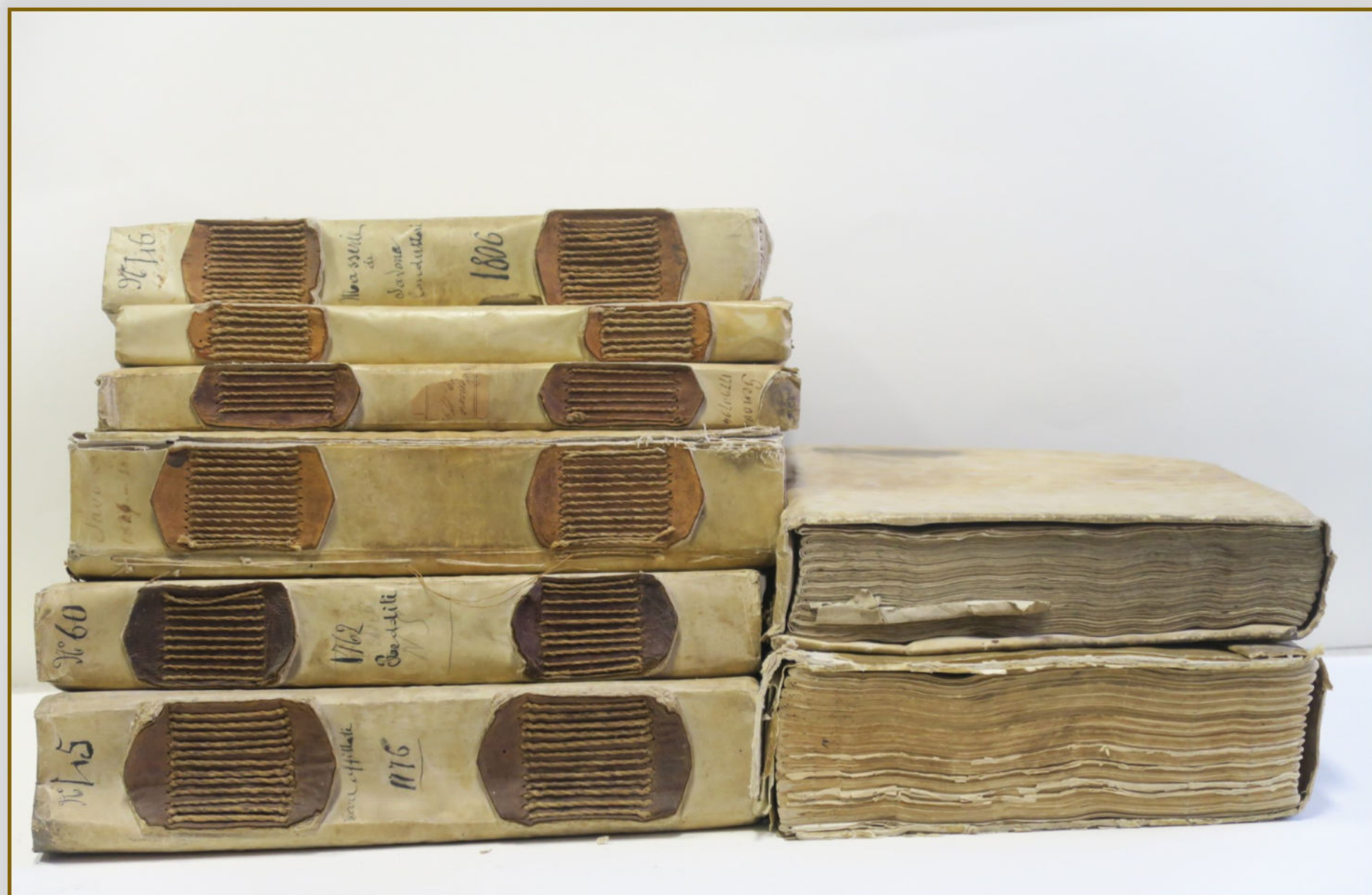
ASSP, Archivio Lamba Doria, registri (secc. XVIII-XIX).