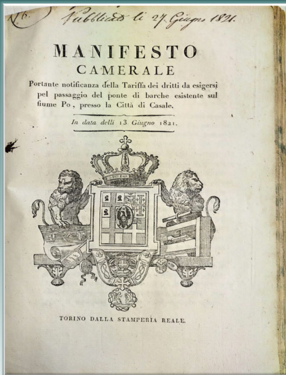
ASSP, Leggi ed Atti del Governo, 1821.