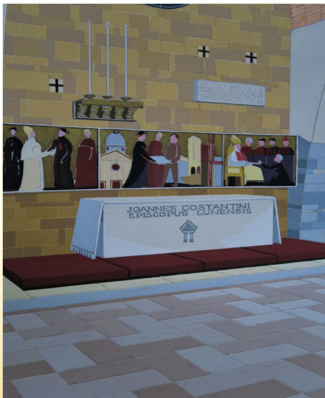
ASSP, Archivio Cesare Galeazzi, particolare dell'altare della Cattedrale di Cristo Re a La Spezia.