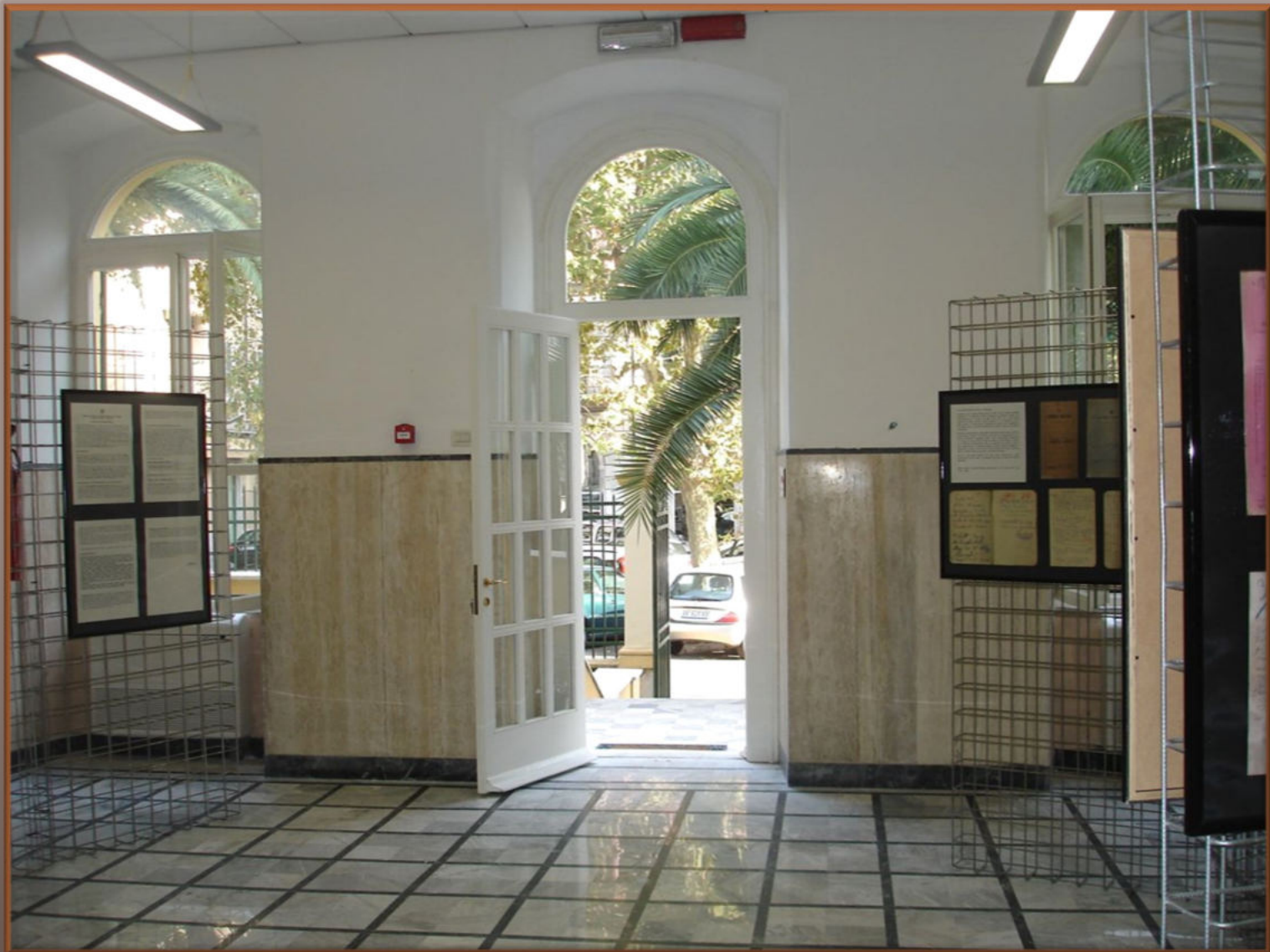
Archivio di Stato di La Spezia, esposizione in occasione del 50° anniversario.