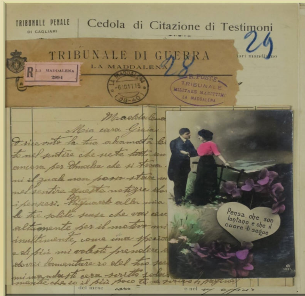
ASSP, Tribunale Militare Marittimo della Maddalena, Fascicoli processuali, b. 6, fasc. 165, 1917.