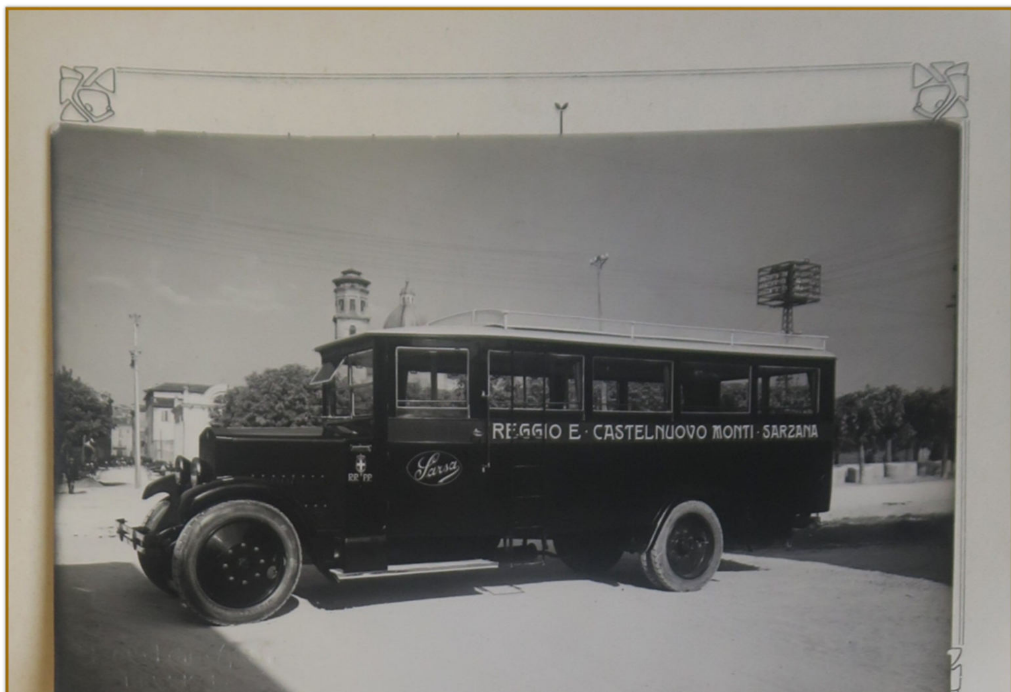
ASSP, Camera di Commercio di La Spezia, Comunicazioni e Trasporti, b. 164, fasc. XI, 1929.