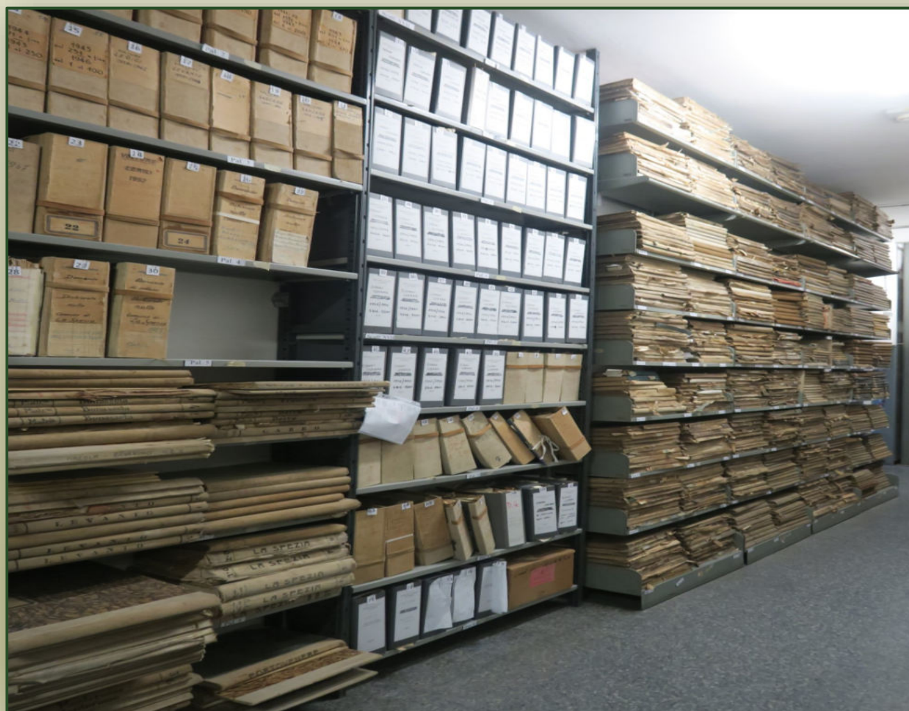
Archivio di Stato di La Spezia, depositi.