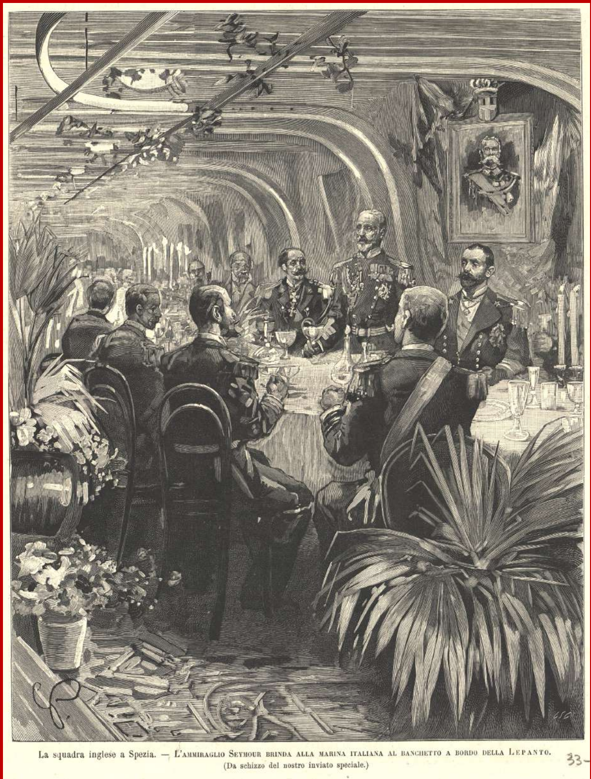
La squadra inglese a Spezia. — L'ammiraglio Seymour brinda alla marina italiana al banchetto a bordo della Lepanto. (Da schizzo del nostro inviato speciale.)